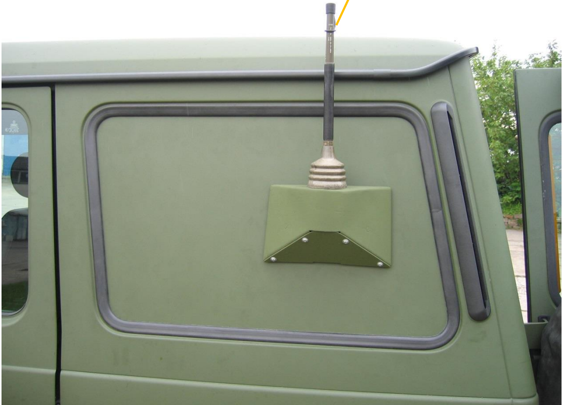
Antennenhalter Funkgerät 2