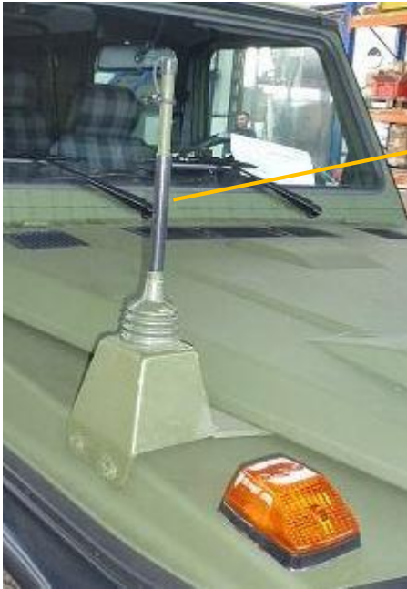
Antennenhalter Funkgerät 1