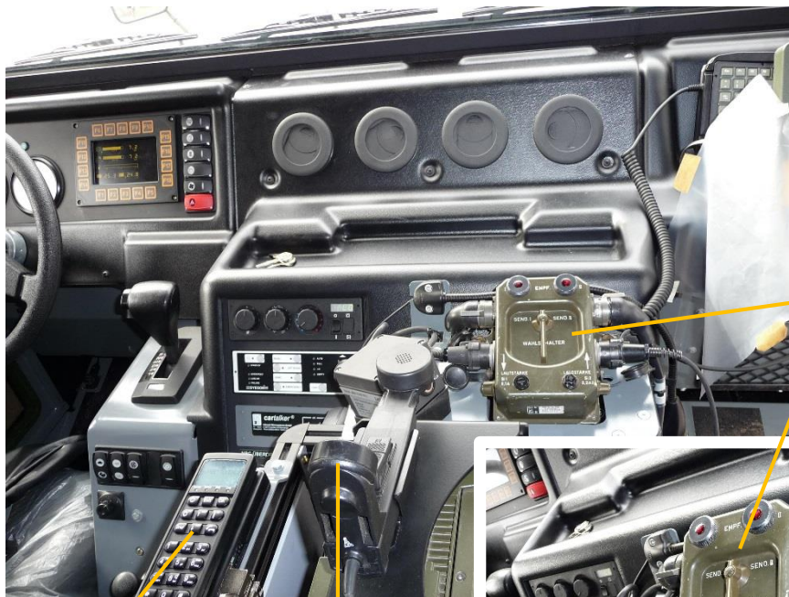
Schaltkasten für Funkgeräte